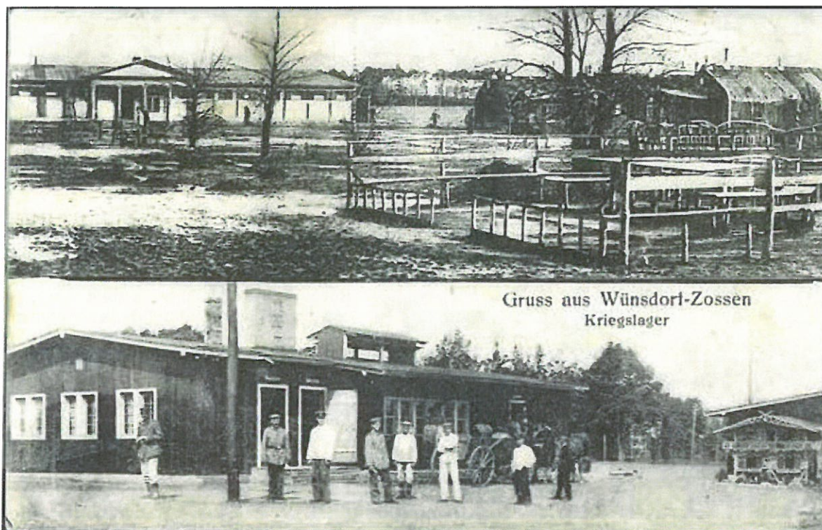
Le camp de prisonniers de guerre de Zossen