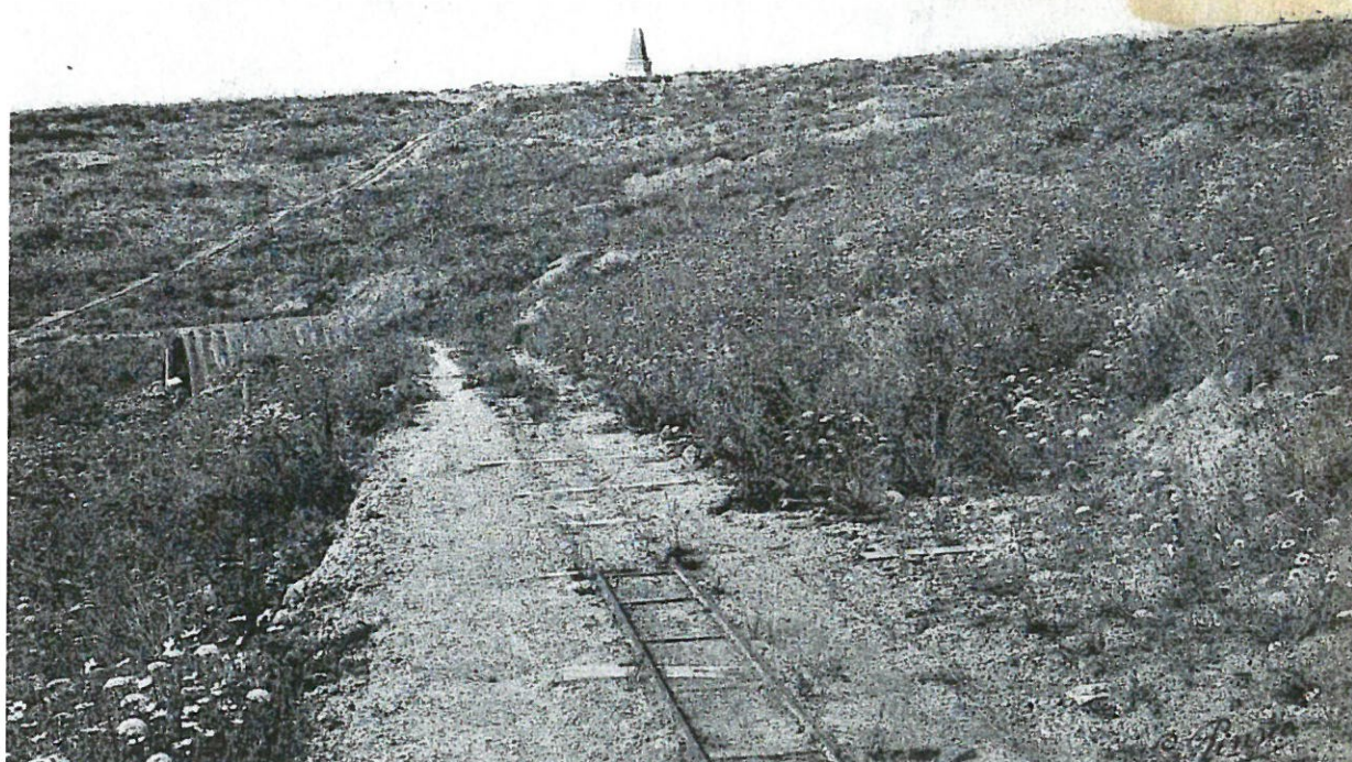
3728. Bataille de VERDUN — Le Mort Homme

Sources: Ministère de la Défense @ mémoire des hommes; Archives militaires du Nord; Historique des Régiments @chtimiste.com; Mairie de Le Cateau; Photo sépulture: Daniel Lefèvre; Cartographie IGN Géo portail;