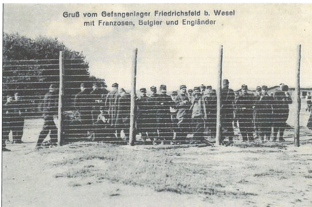
Prisonniers Français dans le camp de Friedrichsfeld