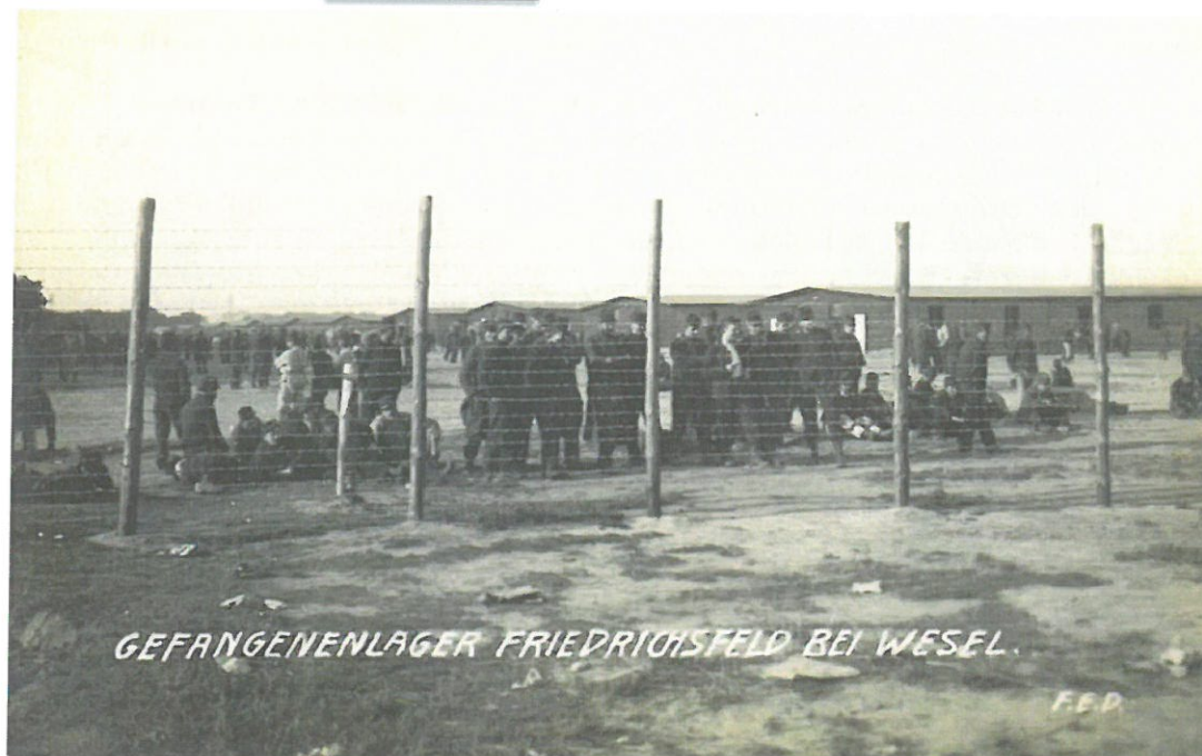
Camp de détention de Friedrichsfeld, près de Wesel, en 1917