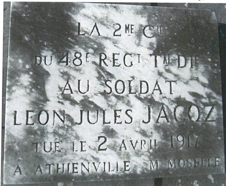
Plaque commémorative sur la tombe familiale au cimetière de Le Cateau

► Dissolution du régiment le 4 mars 1918, mais un bataillon de pionniers du 48 e RIT est formé avec 1200 hommes. Il sera rattaché à la 8 e puis 1 ère armée et 3 e armée, et effectuera des travaux divers dans les régions de Nancy (mars), dans l'Oise (avril-mai), Meaux (juin-juillet), Soissons, Villers-Cotterêts, Laon