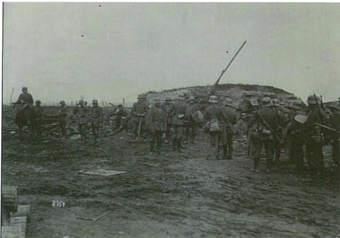
Troupes allemandes dans les décombres d'un village dans le secteur de Messines et Kemmel

1918 Alsace (fév-avril) : attaque de Pont d'Aspach; Flandres (mai): Le Kemmel; Lorraine (mai-août): Nomeny, Raucourt; Aisne (août-oct.) : Pont St Mard, Nampcel, Coucy-le-Château, Folembray, Fresne; La Serre (2 oct- 5 nov.): Bois-les-Pargny, Neuville Housset, Marfontaine, Berlancourt, Voharies, le Vilpion, La Haute Bonde, La Bouteille.