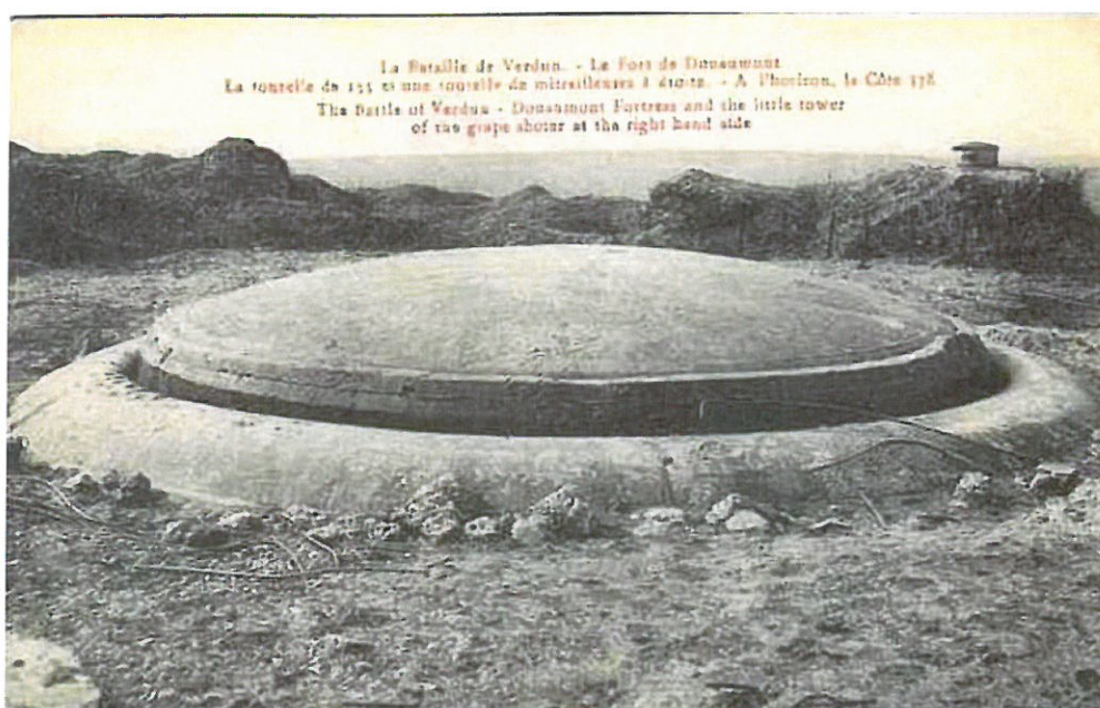
Le Fort de Douaumont, la tourelle de 115 et une tourelle de mitrailleuse à droite. A l'horizon, la cote 170