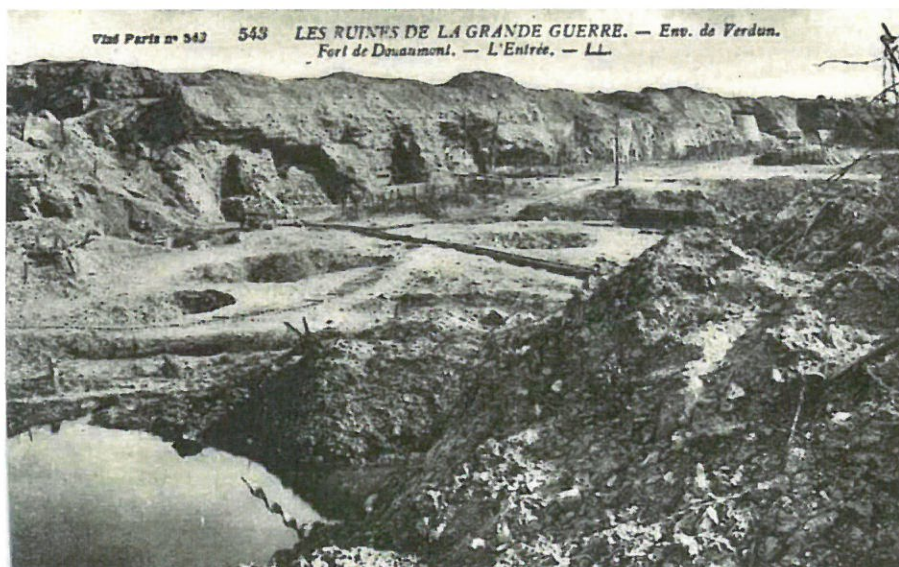
▲ L'entrée du fort de Douaumont après les combats

Alsace: Sudelkopf (sept.-oct.), Roppe, Darney.