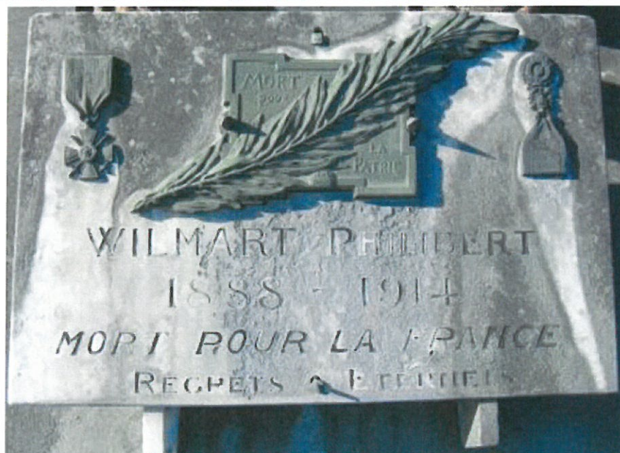
Plaque sur le caveau familial au cimetière de Le Cateau

il est contenu au N par un f te du 48 e qui tient la position le Chêne-Cornantier et au S. par un autre f te du 48 e qui occupe le village de Maclaunay et ses abords ; le 2 e B n dans le maison, à proximité de la limite N.E. de Maclaunay ; le 1 er B n en cantonnement d'alerte partie O. de Maclaunay le 9 e sauret. et la 2 e Brig te est ramené à 20 h. Placé à Maclaunay le Lt Col. Guyot, com te le 1 er R g , prend le C te paroisserie de la 2 e B n