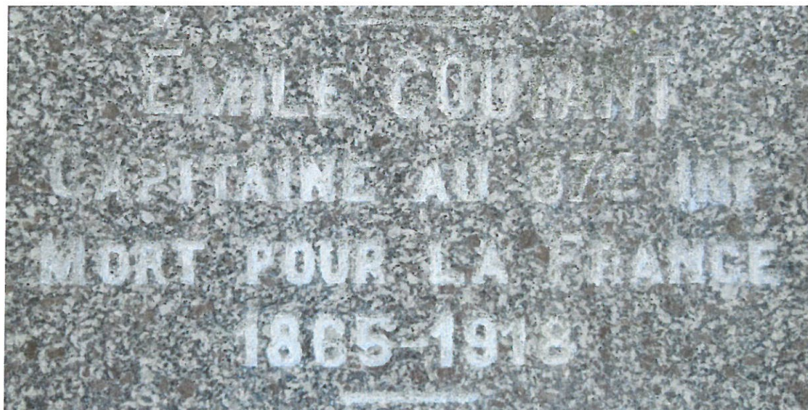
Plaque sur la tombe de la famille Coutant