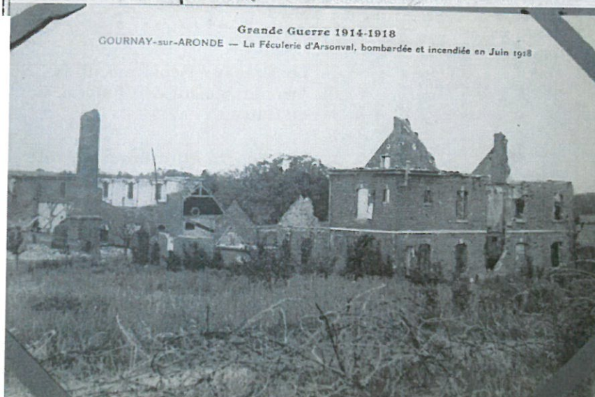
Grande Guerre 1914-1918 GOURNAY-sur-ARONDE — La Féculerie d'Arsonval, bombardée et incendiée en Juin 1918

◀ La féculerie d'Arsonval après la guerre