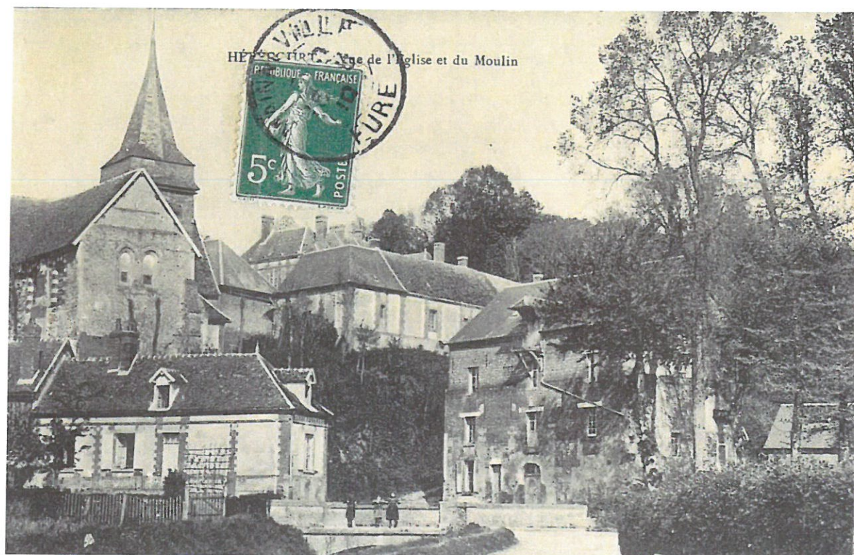
Hébecourt, l'église et le moulin en 1910