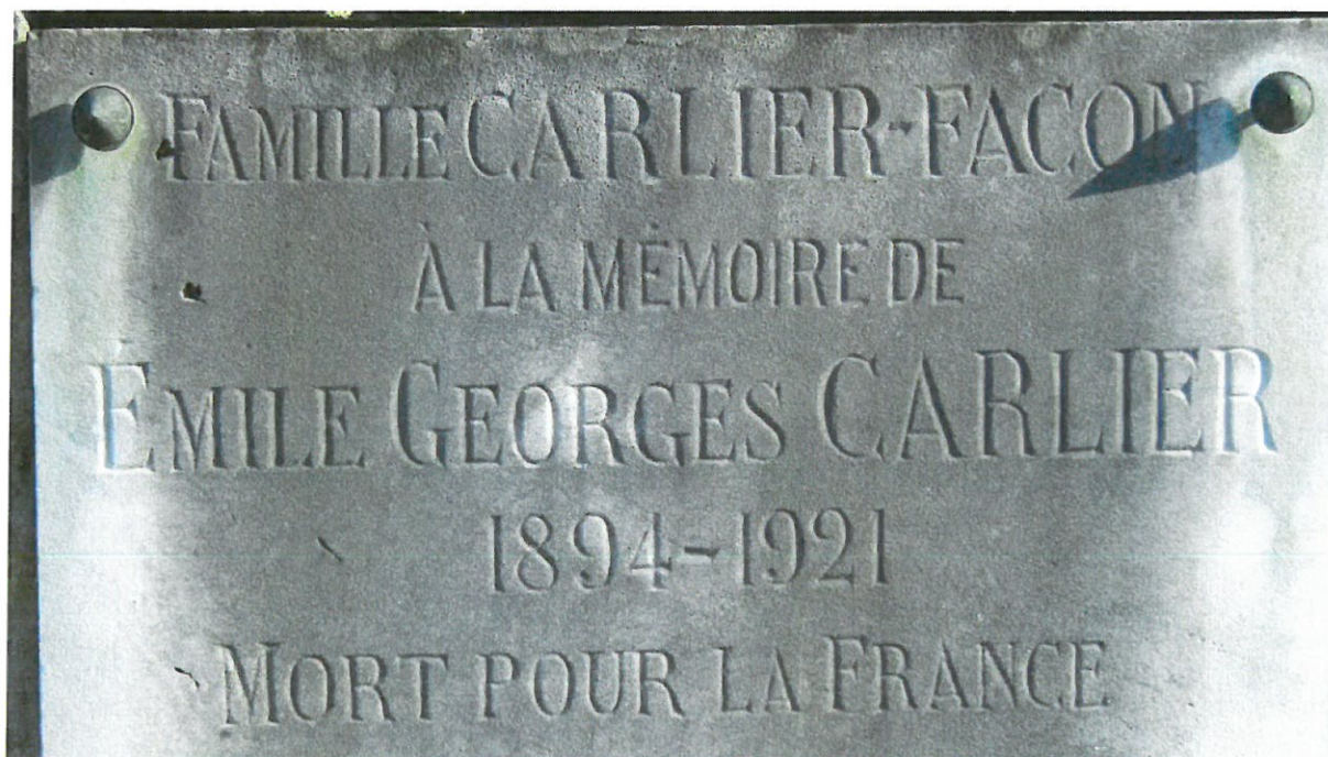
Plaque mortuaire sur le caveau familial au cimetière de Le Cateau.