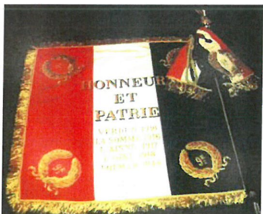
Le drapeau du 9 e Régiment du Génie

Il porte, cousues en lettres d'or dans ses plis, les inscriptions suivantes: Verdun 1916; La Somme 1916; L'Aisne 1917; L'Oise 1918; Colmar 1944