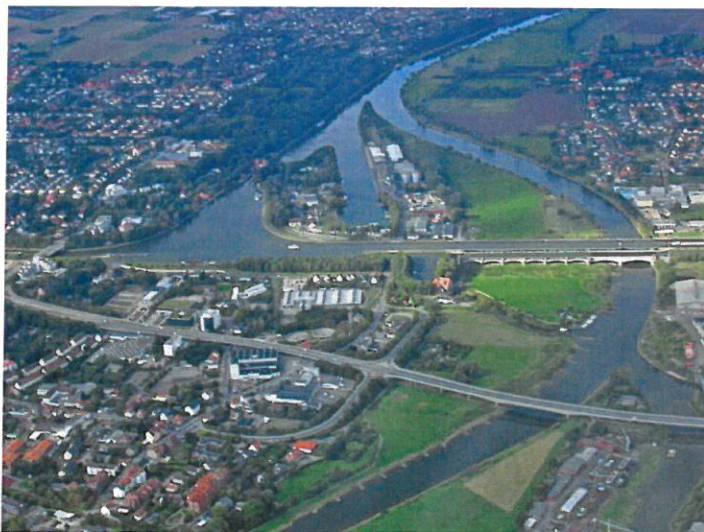
Vue aérienne de Minden ▲