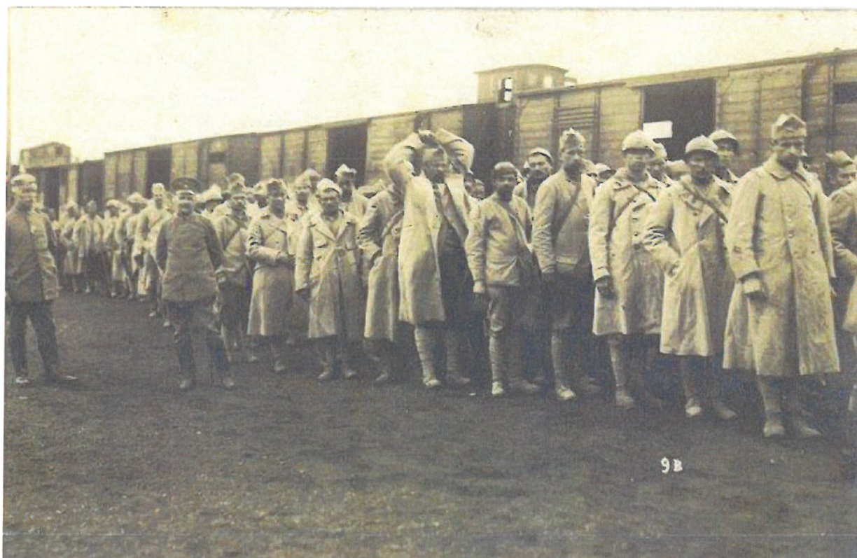
Arrivée de prisonniers français à la gare de Wilhemshöhe