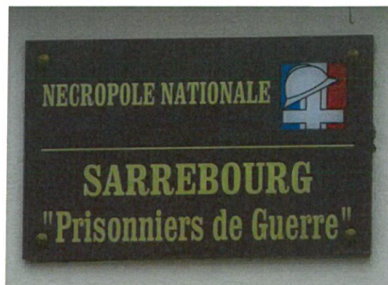
Sépulture de Charles Fontaine Nécropole Nationale de Sarrebourg, tombe individuelle N°650,

► En juillet, des soldats du 324e RI, dissous, rejoignent le 164e RI.