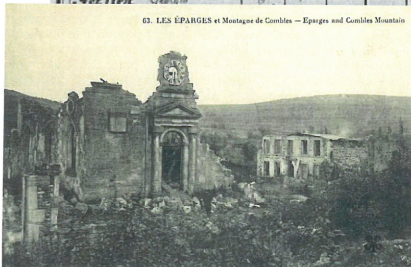
63. LES ÉPARGES et Montagne de Combles — Eparges and Combles Mountain

▲ Etat des pertes de la journée: Tués 26, Blessés 51, Disparus 79