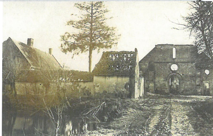
Les ruines de l'église de Vermandovillers

Officiers blessés : Lieut. Bessé - S t Lieut. Bayssat 14 e C m