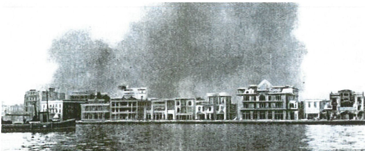
Photo, prise d'un destroyer anglais, de l'incendie de la vieille ville de Salonique en août 1917. 9.500 bâtiments seront détruits et 70.000 personnes sans abris.