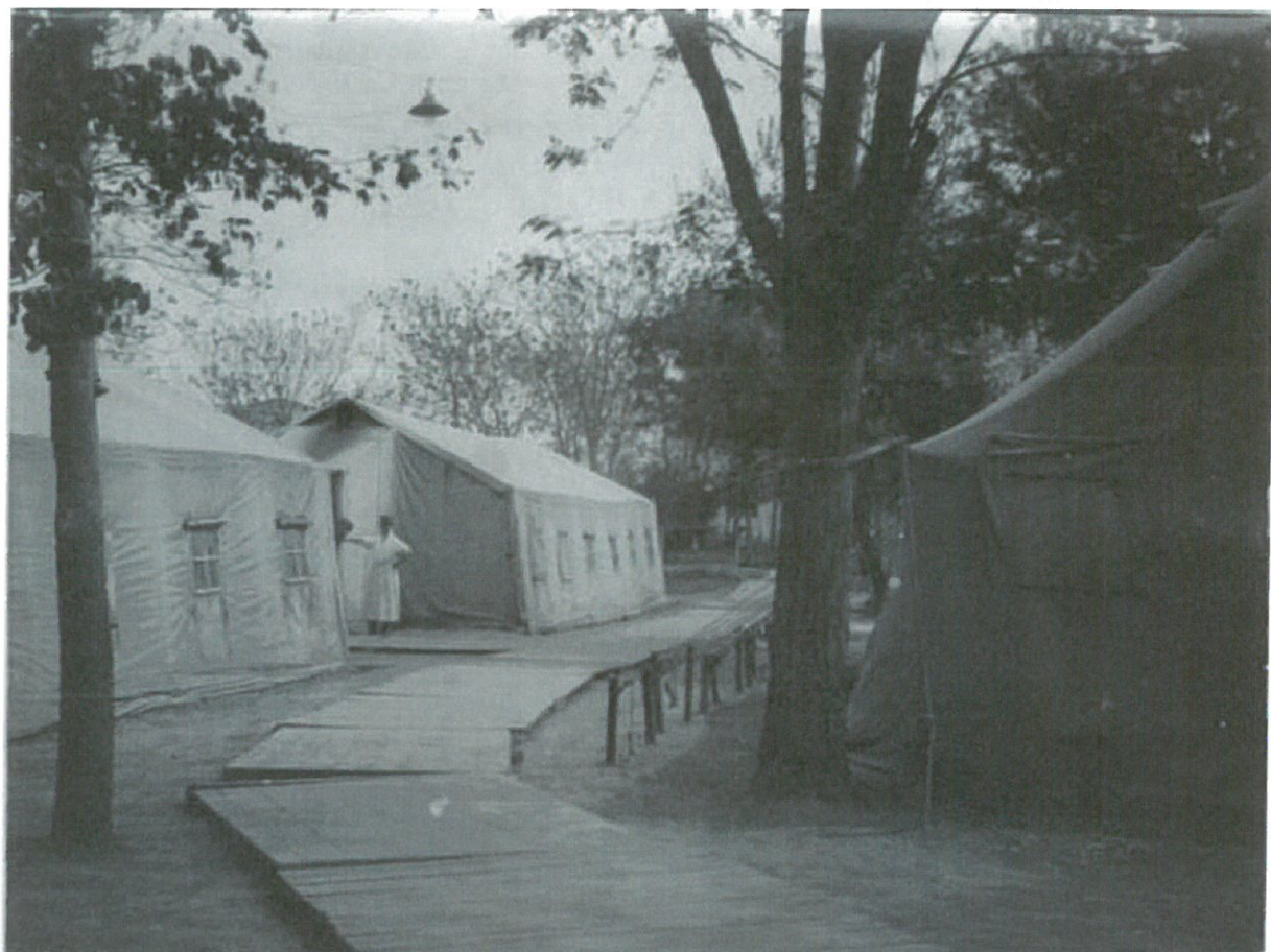
L'Hôpital à Thessalonique, entre octobre 1915 et juin 1916 Les tentes de l'Hôpital Princesse Marie, camp retranché de Salonique

Sources: Ministère de la Défense @ mémoire des hommes; Archives militaires du Nord; Historique des Régiments @chtimiste.com; Mairie de Le Cateau; Photo Salonique: "The Popular Mechanics" décembre 1919; Cartographie Google Maps; Hôpital: Ministère de la culture;