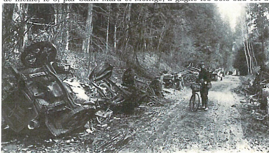
91. GUERRE DE 1914. — Dans la forêt de Villers-Cotteret. — Convoy automobile allemand incendié

Le 20, au petit jour, le 5 e bataillon réussit à repousser une vigoureuse contre-attaque de l'ennemi dans les rangs duquel nos mitrailleuses font de terribles ravages. Les Allemands prennent pied dans nos tranchées les plus avancées, ils en sont rejetés et le terrain reste acquis.