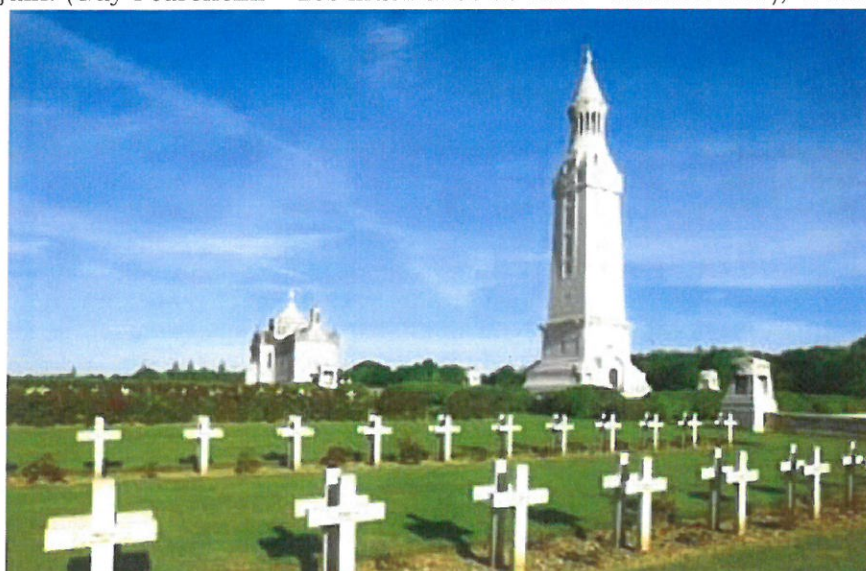
La Nécropole Nationale de Notre Dame de Lorette (Pas de Calais)

1918 Vosges (janv.-mai): Le Sudelkopf; Aisne (mai-juin): Fismes, Mont-Saint-Martin, ferme Ressons (fin mai), Saint-Gilles, Vandières, Dormans; Champagne (juillet): Souain, Mont Muret, bois du Hanneton, bois de l'Araignée, crête d'Orfeuil (02/10), Gomont, Saint-Fergeux; Ardennes (nov.): Hauteville, Sery, Justine, Mesmont, Granchamp, Signy.