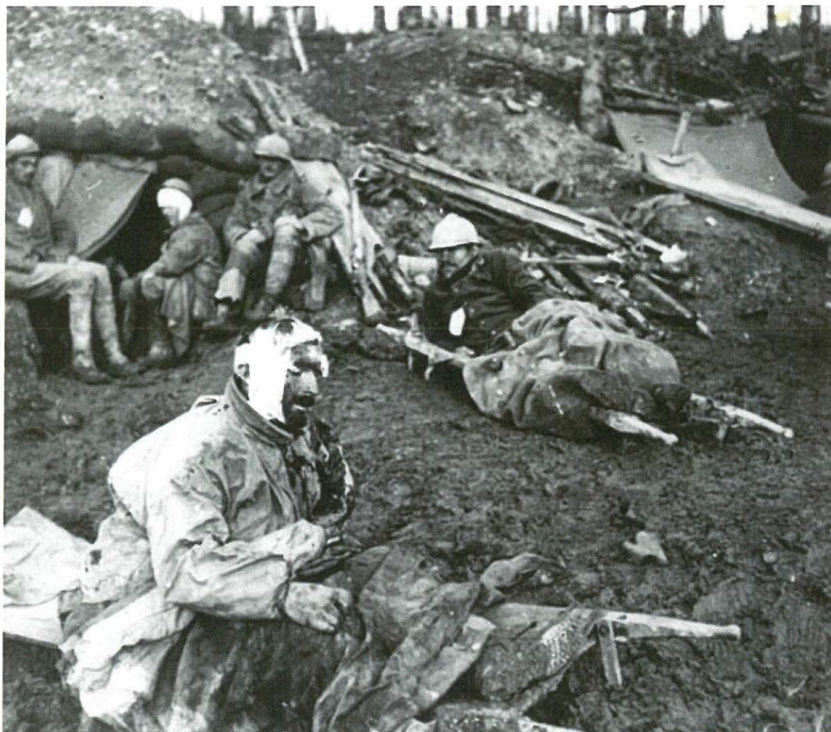
Soldats Français blessés sur le champ de bataille à Verdun

Pas d'information disponible pour cette date