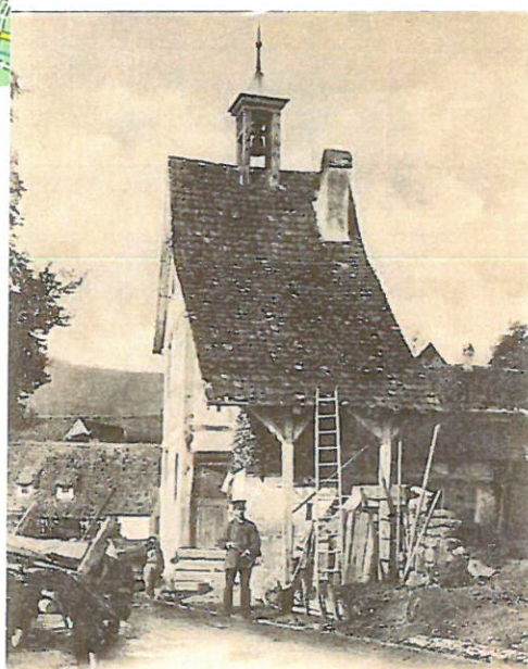
Gemeindefausthaus in Weiler

Weiler est situé à 2km de Wissembourg, sur la RD 334.