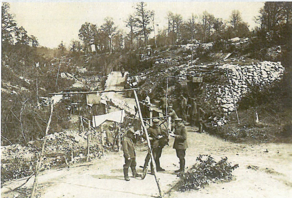
Camp allemand dans les environs de La Harazée

Situation calme sur tout le front, sauf à S t Hubert où la fusillade est intermittente à raison de la grande proximité de l'ennemi. Les renseignements fournis par de nombreuses patrouilles confirment que l'ennemi s'est fortement retranché et couvert de défenses accessoires devant le front du 3 e B st , à une distance variant de 80 à 100m de nos tranchées. Devant le 3 e B st la ligne ennemie rejoint presque directement la Fontaine Madame , barant tout les chemins à une distance allant de 200m à droite jusqu'à 400m au centre de nos tranchées. Il paraît travailler à des abris vers la Fontaine Madame .