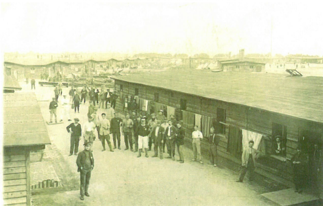
Le Camp de Friedrichsfeld

Il n'existe pas de JMO pour ce régiment en 1914.