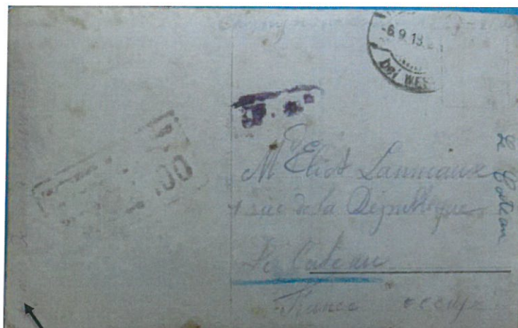
Verso de la photo de groupe

Le texte sur le côté gauche est: « Merci pour de votre envoie »