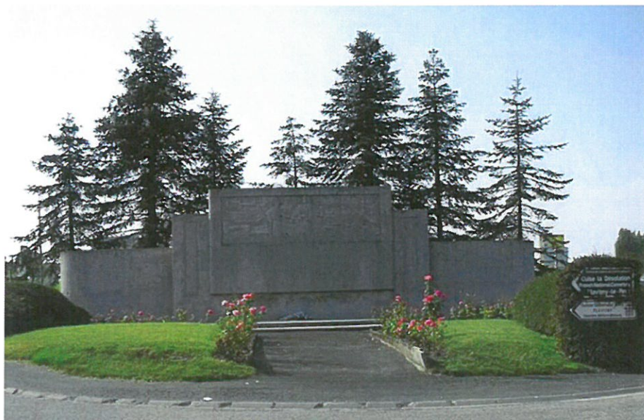
Monument à la gloire de la 5 e Armée Française lors de la bataille de Guise

1918 Aisne: Craonne (jan.-mars); Oise: Noyon, Forêt de Retz (mars à mai) ferme Chavigny (juil.); Marne : Grand Rozoy, Plessier (18-28 juil.); Alsace : Metzeral (sept.-oct.).