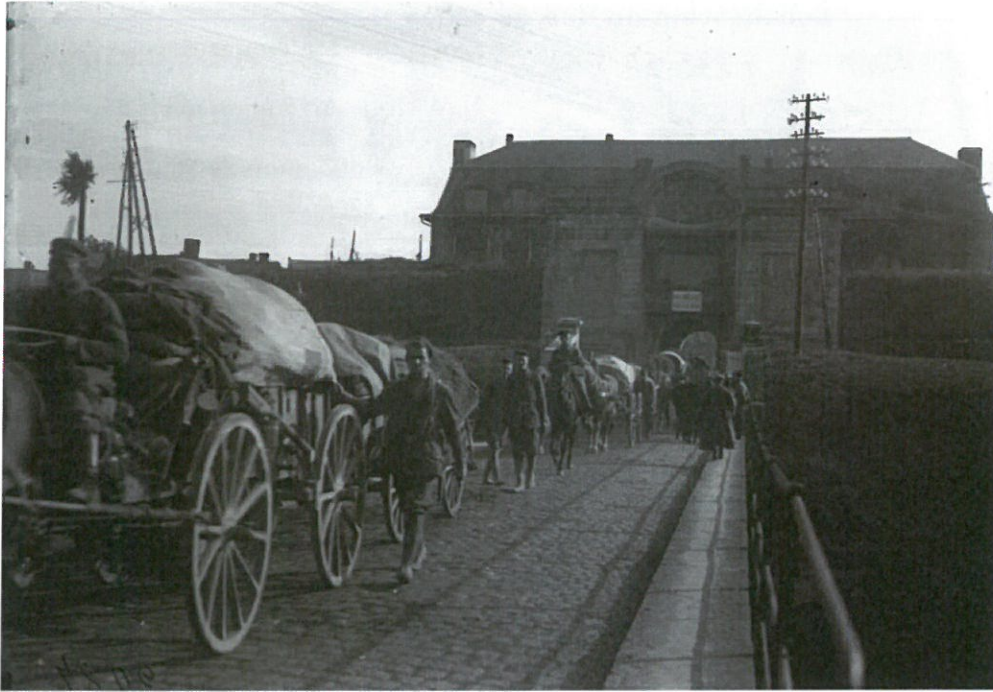
Troupes allemandes sortant de la porte de Mons à Maubeuge

Bundesarchiv, Bild 115-2087 Foto: s. Ang. | 1914/1918