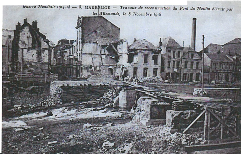
Guerre Mondiale 1914-18 — 8. MAUBEUGE — Travaux de reconstruction du Pont du Moulin détruit par les Allemands, le 8 Novembre 1918