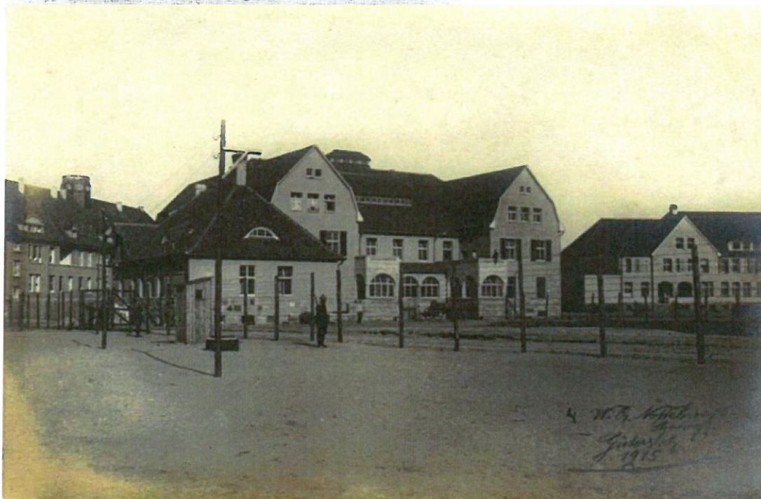
Le camp de prisonniers de Gütersloh en 1915 (photo allemande)