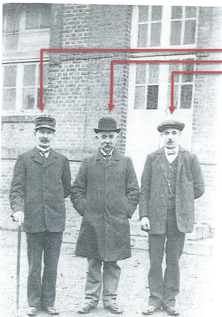
L'équipe dévouée responsable du ravitaillement à Ors auprès du Comité d'Alimentation.