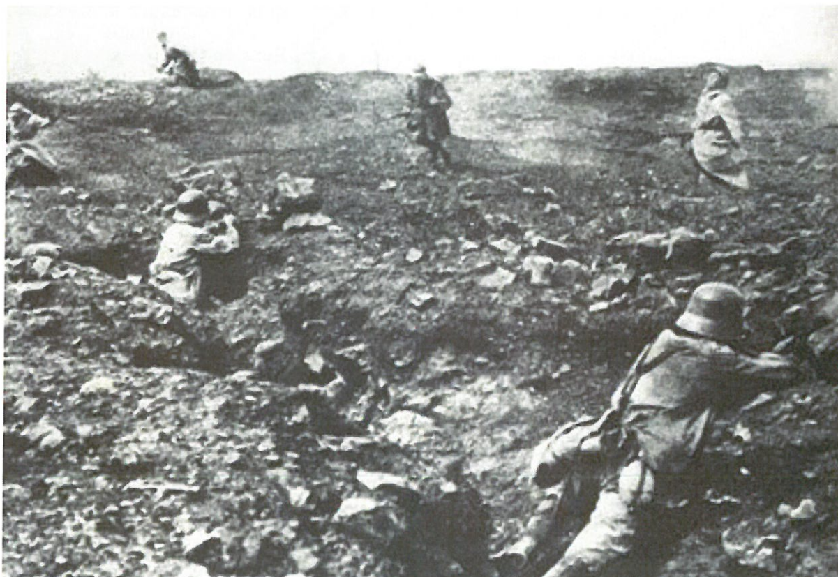
▼ Les restes du bois après les combats ▼