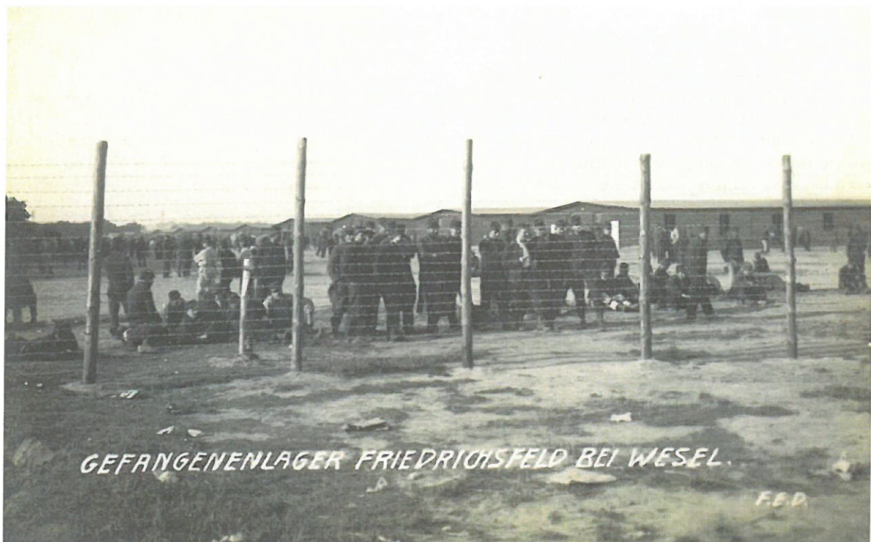
Camp de détention de Friedrichsfeld, près de Wesel, en 1917

► Maubeuge fut assailli par environ 60.000 Allemands, du 29 août 1914 au 7 septembre 1914, date de la reddition. Parmi les 45.000 combattants, dont 3.000 blessés, et les 1.300 soldats qui payèrent de leur vie la défense de la poche de Maubeuge, les soldats furent internés, jusqu'en décembre 1918, janvier 1919, dans les camps allemands de: Chemnitz, Seltau, Hamborn, Minden, Grüneberg, Seeste, Uretz, Eichstalt, Dulmen, Friedrichsfeld, Gelsenkirchen, Bernig, Zebst, et Altenessen. (Liste non exhaustive)