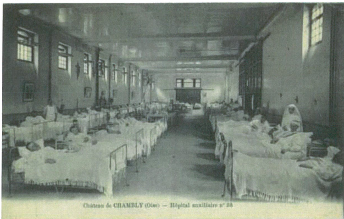
Château de CHAMBLY (Oise) — Hôpital auxiliaire n° 26

Pas d'informations car décédé suite à maladie