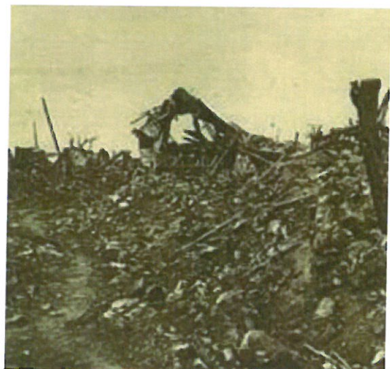
La rue principale de Laffaux après les combats de mai 1918

La 2 e bataille de la Marne puis la reprise du Chemin des Dames sont engagées: