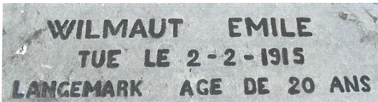
Plaque mortuaire sur la tombe familiale au cimetière de Landrecies.