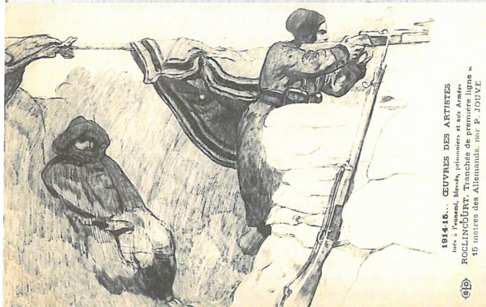
◀Tranchée de première ligne, vue d'artiste, 1914

16 janvier. Cantonnement à Estrun de tout et 17. le Bataillon - Rien de particulier à signaler. 18 et 19 Le Bty occupe les tranchées dans janvier. le Secteur de Rochemourst. 20.21 et Cantonnement du Bataillon à 22 janvier. Hermaville après avoir été relevé par le 1er Bataillon -