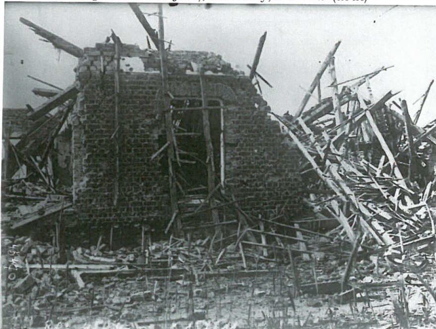
Usine détruite à Lizerne après le bombardement franco belge en 1915

1918 Aisne: Coeuvres, Valsery (juin), plateau des Trois-Peupliers (juin), Saint Pierre l'Aigle (juil.); Marne: Montagne de Paris (juil.), Fontenoy, cote 129 (août)