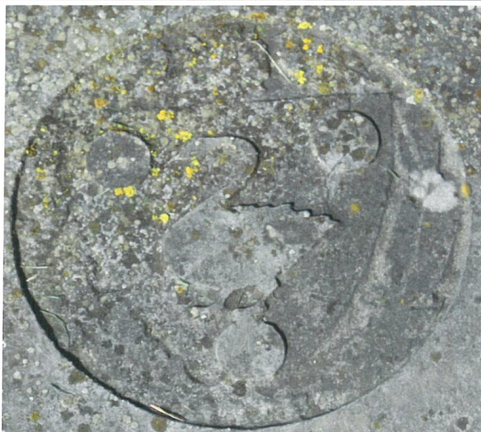
Détail du blason gravé sur la tombe d'Edmond Furgerot