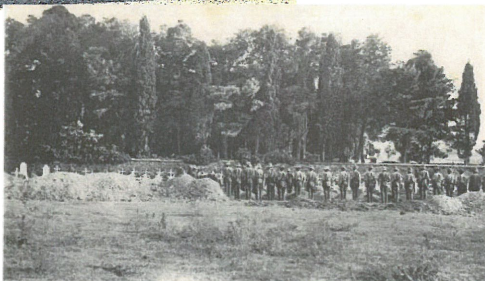
193. - SALONIQUE - Cimetière des Alliés à Zeitenlik, côté Anglais

Carte postale datée du 16 septembre 1918 montrant le côté Anglais du cimetière de Zeitenlik ▼