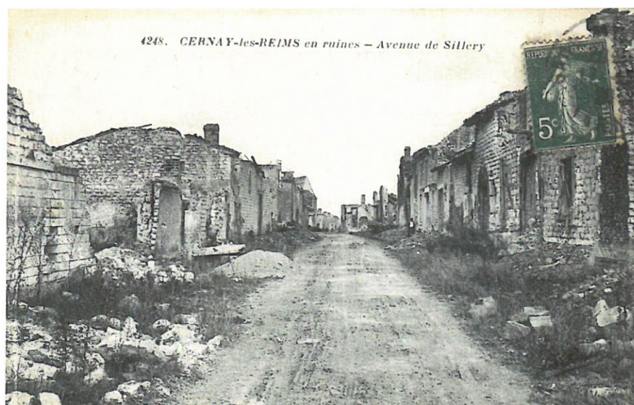
4248. CERNAY-lès-REIMS en ruines - Avenue de Sillery

Sources: Ministère de la Défense @ mémoire des hommes; Archives militaires du Nord; Historique des Régiments @chtimiste.com; Mairie de Le Cateau; Mairie de Paris 17 e ;