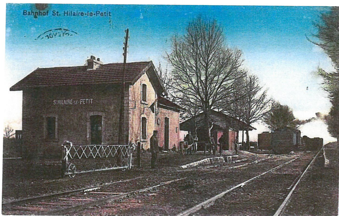
Carte allemande de la gare de Saint Hilaire le Petit ▲