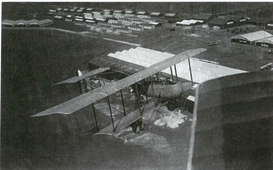
Farman F40 en vol au dessus de l'école d'aviation militaire de Châteauroux. L'escargot de l'insigne de l'escadrille 1 rappelle de manière humoristique la lenteur des avions Farman.