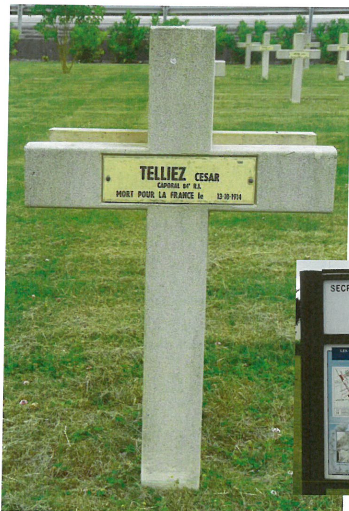
Sépulture de César Telliez, Nécropole nationale de Cormicy