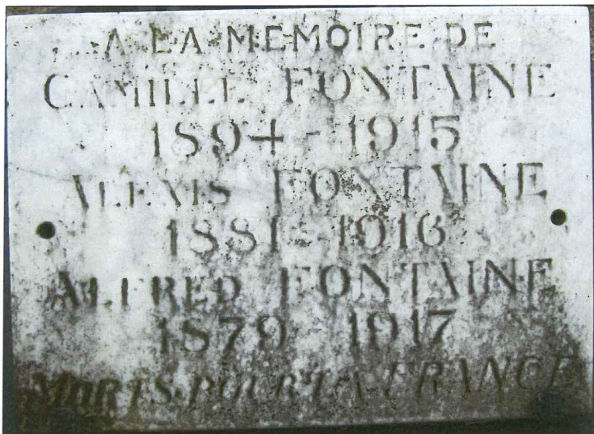
Plaque au cimetière de Le Cateau portant les noms des 3 frères Fontaine, tués à un an d'intervalle chacun