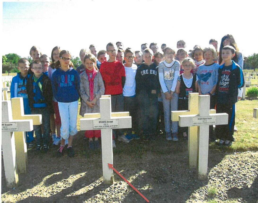
Sources: Ministère de la Défense @ mémoire des hommes; Archives militaires du Nord; Historique des Régiments @chtimiste.com; Mairie de Le Cateau; Cartographie IGN Géoportail; Texte et photos Ecole Herbin : Pierre Demaret. Merci aux enseignants de m'avoir invité à participer à ce voyage.

Retour au Capeau vers 18 h30, la tête remplie d'images et de paroles, qu'il ne faudra pas oublier car l'interrogation sur le voyage sera prochainement programmée.