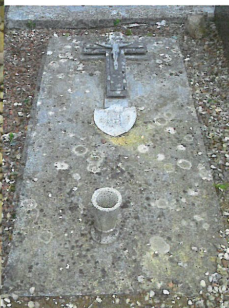
La tombe d'Alcide Minaux dans le cimetière de Le Cateau.