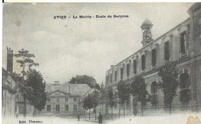
Avize : La Mairie et l'école de garçons

Sources: Ministère de la Défense @ mémoire des hommes; Archives militaires du Nord; Historique des Régiments @chtmiste.com; Mairie de Le Cateau. Mairie de Quièvy, Mairie de Bohain (Aisne); Cartographie IGN Géoportail;